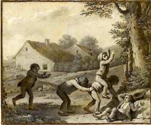
Juego del cheval fondu (Fragonard) = ¿juego al paso? ¿Lo mismo que la pídola?