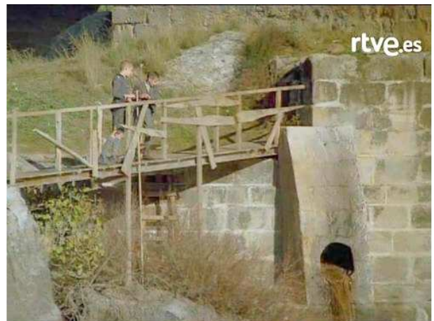
desde la serie televisa de Mario Camus

Delante de la casa del tío Granizo hay un puentecillo de madera, hecho con dos rieles del tren atravesados y cubiertos de tablones, con su barandilla y todo, pintado de verde. Allí pasa un río negro que sale de un túnel debajo del punte del Rey ; este túnel y este río son la alcantarilla de Madrid. Todas las pelotas que pierden los chicos en las calles de Madrid, porque se les cuelan por las bocas de las alcantarillas, bajan flotando, y nosotros, desde lo alto del puente, las pescamos con una manga hecha de un palo largo y la alambreira vieja de un brasero. Una vez cogí una de goma pintada de colorado.