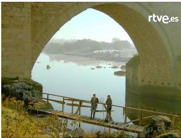
desde la serie televisa de Mario Camus

A veces acompaña hasta el río Manzanares a su madre viuda que ejerce de lavandera . Vive en casa de un tío acomodado mientras sus hermanos se quedan con la madre en una buhardilla en lo alto de una corrala .